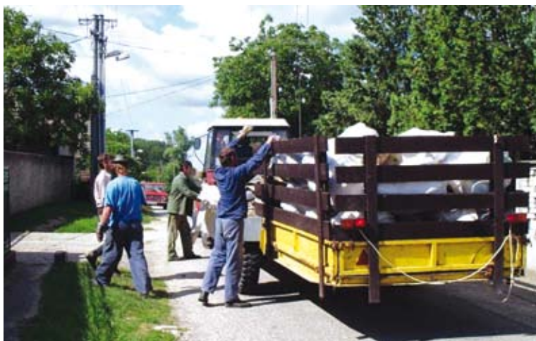
Zber v Palárikove.

Humenné - Možnosti zlepšenia vidíme najmä v edukácii obyvateľov, aby boli disciplinovanejší pri triedení odpadov a väčšej frekvencii počtu a intervalov zvozu.