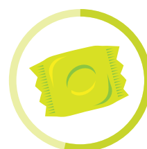
ŽUVAČKA 5 ROKOV