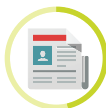
NOVINY 3 - 12 MESIACOV