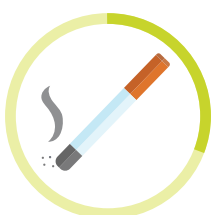
CIGARETA 3 MESIACE - 2 ROKY