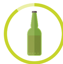
SKĽO 4000 ROKOV