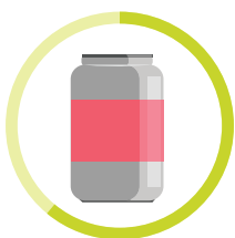
PLECHOVKA 20 - 100 ROKOV