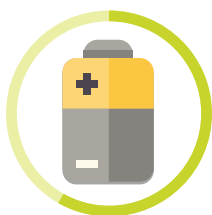
BATÉRIA 200 - 500 ROKOV