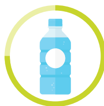
PET FĽAŠE 100 - 1000 ROKOV