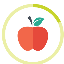
OHRYZOK JABLKA NIEKOĽKO TÝŽDNŇOV

Ako dlho trvá rozklad odpadu v prírode, keď ho tam vyhodíme?